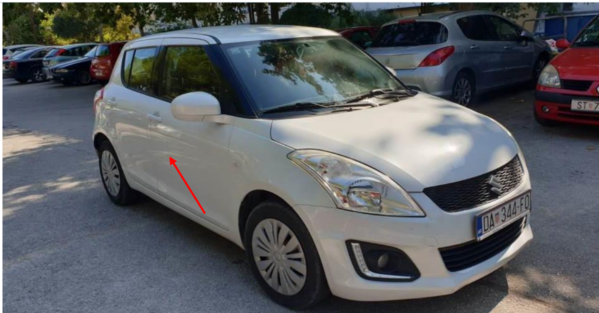
Slike 1. do 10.: Prikaz općeg stanja automobil, oštećenog mjenjača i oštećenja koja su označena strelicama